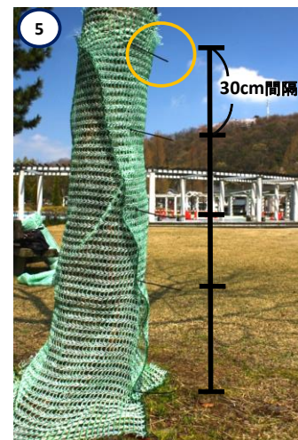
5 ロックタイの突き出した部分はそのままに。