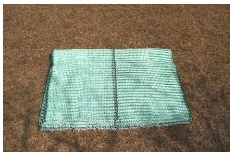
BioGreenWild・ARC・ワイルド 梱包をほどいた状態