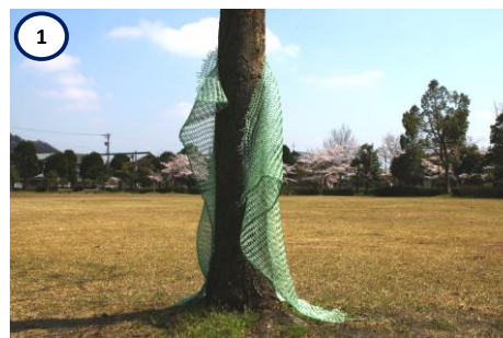
1 ネットを樹皮に引っ掛ける。 (ネットは樹皮に絡みやすくなっています。)