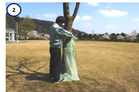
2 ネット下部(5cm~10cm)を足で押さえ、 樹木に巻き付ける。