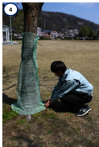
4 下部(ハカマ部分)は引っ張りながら、 微調整し、ロックタイで留める。