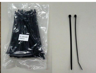
ロックタイ 左:100本/袋 右:バラ